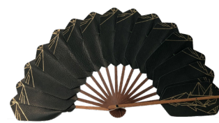
DUVELLEROY X LUCIE MONIN éventail, palmes en cuir, 2018