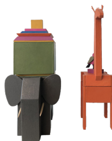
ATELIER PHILIPPE MARTIAL boîtes éléphants et girafe, gainées de cuir, 2017