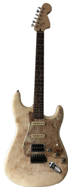
ATELIER BETTENFELD-ROSENBLUM - ABR PARIS guitare électrique, parchemin patiné à la main, 2017