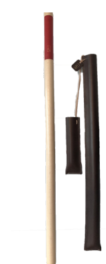
DAMIEN BEAL brigadier de théâtre, bois de hêtre et cuir tannage végétal, cousu main, création pour l'exposition Cuir en Scène, 2019